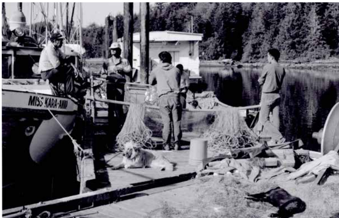
Lagning av laxgarn, Maaqtuosis-reservatet, ahousamt tribe, Flores Island, juli 1993.

For millennia the salmon have "hedged their bets" against major catastrophes, such as ice ages, continental uplifts and volcanic eruptions. They have done so by maintaining a diversity of populations and habitats – in short they have developed a rich and varied sets of genes. Salmon should be allowed to continue pursuing their survival strategy – a strategy that worked before humans arrived on the continent and, if these fish manage to survive, will work long after we are gone (Levin, P.S., Schiwe, M.H., 2001: 227).