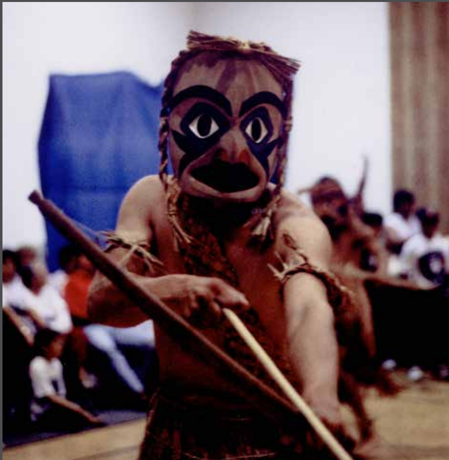
Maskerad dansare från hunters dance, hesquiaht maj 1993.