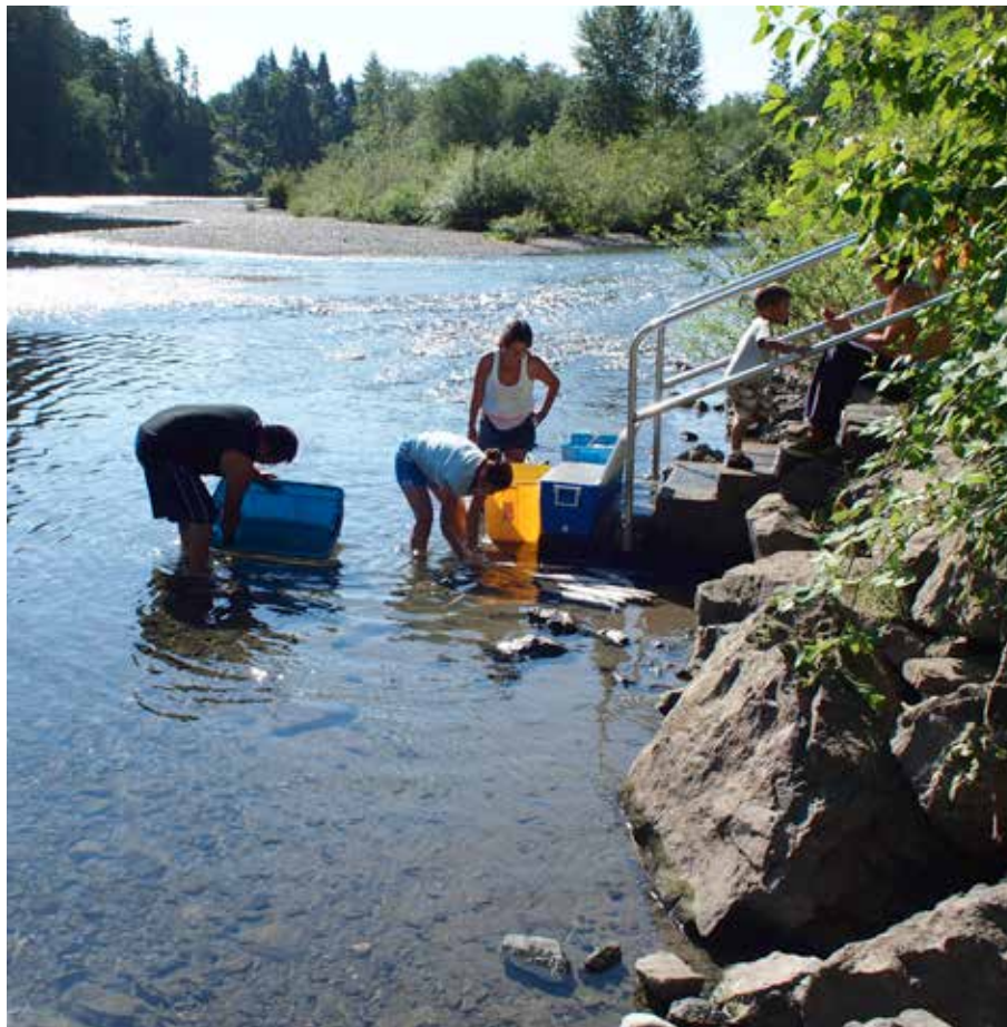
Rensning av Sockeye-salmon, Somass River, Tsa-ha-ee reservatet, Tseshaht. Foto juli 2010.