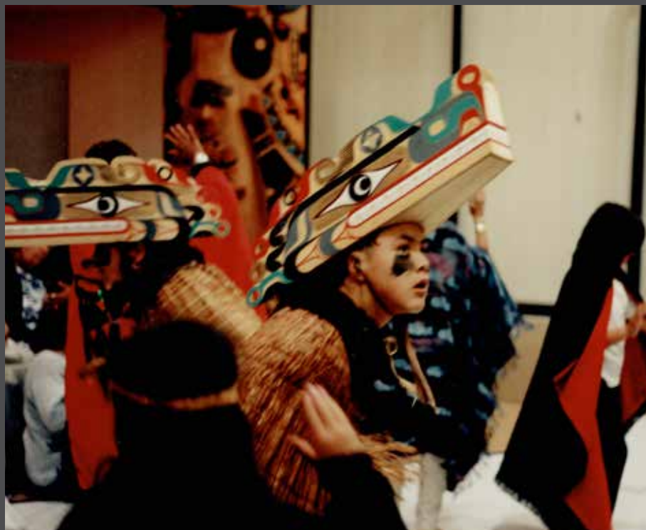
Himkeetsdancers augusti 1998, hesquiaht.